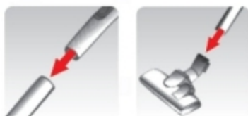
(شکل ۲ و ۳)

• کوپلینگ انتهایی لوله خرطومی را در محل اتصال (دهانه مکش) جاروبرقی قرار داده و به داخل فشار دهید با شنیدن صدای تق در محل خود محکم خواهد شد. (شکل ۱)